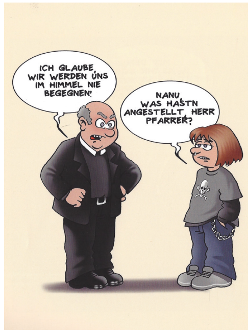
ABB. 5. Habicht (2019, S. 64)

Dieser Witz durchbricht bereits auf der visuellen Ebene die Konstellation der vorangegangenen Cartoons. Hier steht dem Lehrer eine Schülerin (oder ein Schüler) gegenüber, welche oder welcher als Punk, Slacker oder Metal-Fan identifizierbar ist. Die dargestellte Interaktion ist nicht notwendig in der Unterrichtssituation verortet; sie kann auch auf dem Schulgang, in der Pause oder in einem öffentlichen Raum jenseits von Schule platziert sein: