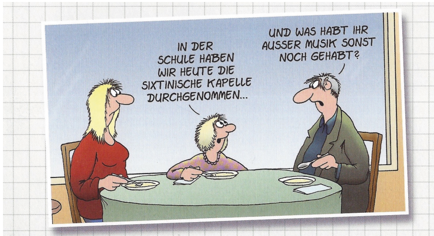
ABB. 3. Stein (2020, S. 36)

men ...“ Darauf antwortet der Vater: „Und was habt ihr außer Musik noch gehabt?“ (Stein, 2020, S. 36).